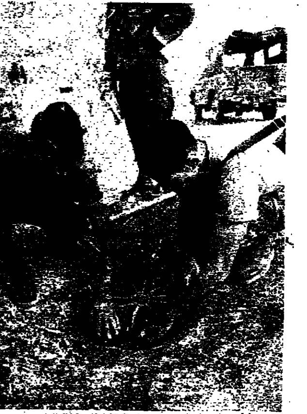
في الشلوبيه: ازاله قذيفة ملون ٢٤٠